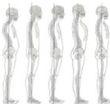
Allineamenti posturali secondo Kendall

trovati quindi i recettori disfunzionali c'è la possibilità di effettuare correzioni o inibizioni delle strutture-recettori corporei disfunzionali (che stanno lavorando male) e rifare i test per valutare la risposta sulla postura e sul sintomo. Questo permetterà dunque di delineare se c'è bisogno di consultare una determinata figura specialistica e soprattutto costruire il percorso terapeutico più idoneo, rapido ed efficace